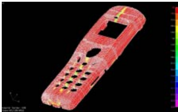
ウエルド解析結果